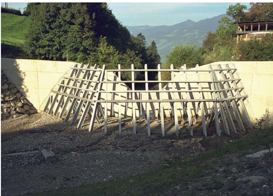
Bild 3. Geschiebesammler am Dorfbach von Sachseln mit Grobrechen zum Schutz vor Geschwemmseil. Die kleine Durchlassöffnung staut den Sammler schnell ein, sodass die Geschiebedurchgängigkeit bereits bei kleineren Hochwasser nicht mehr gewährleistet ist.

Die Gewässersohle ist ein wichtiger Lebensraum für verschiedene Pflanzen und Tierarten. Es ist bekannt, dass menschliche Eingriffe wesentliche Auswirkungen auf die Struktur der Gewässersohle haben. Hierzu zählen unter anderem die Kolmatierung oder Eintiefung der Gewässersohle durch verminderte Geschiebedynamik oder durch Geschiebeentnahme. Die Auswirkungen dieser Eingriffe auf das Zoobenthos der Gewässersohle ist in verschiedenen Studien untersucht worden. Weitgehend unbekannt ist allerdings, wie sich Sanierungsmassnahmen in Form von Geschiebezugaben oder -mobilisierungen auf das Zoobenthos auswirken. Darüber hinaus ist von Interesse, ob Änderungen in der Zusammensetzung des Zoobenthos im Zuge von Geschiebesanierungen als Indikator zur Erfolgskontrolle oder für Monitoringprogramme herangezogen werden können. In diesem Zusammenhang ergeben sich folgende Fragen: Wie wirkt sich eine Geschiebezugabe sowie eine räumlich und zeitlich veränderte Geschiebedynamik auf die Verteilung und Zusammensetzung der Zoobenthosgemeinschaften aus? Zeigen die Gemeinschaften ein allgemeines Verhalten in Bezug auf eine geänderte Geschiebedynamik und/oder infolge von Geschiebezugaben? Können Veränderungen der Zoobenthosgemeinschaften herangezogen werden, um aussagekräftige und praxistaugliche Indikatoren zu definieren für eine Bewertung des Ist-Zustands, zur Prognose der Auswirkungen von Geschiebezugaben und -dynamisierungen sowie für eine Erfolgskontrolle?