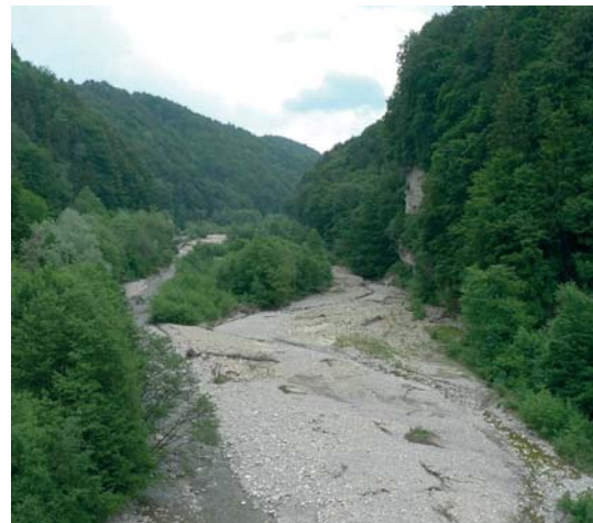
Bild 5. Geschiebe- und Lebensraumdynamik machen Auenlandschaften zu den artenreichsten Ökosystemen der Schweiz.