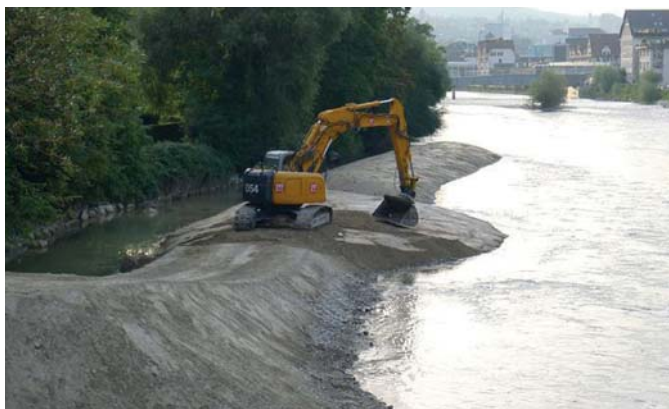
Bild 2. Kiesschüttung Breitensteinstrasse in der Limmat. Blick gegen die Fließrichtung.

durchgeführt, um die im Labor gemessenen Erosionsraten zu reproduzieren. Die Arbeit vertieft das Grundlagenwissen zum Prozess der Seitenerosion und dessen Parametrisierung für die Prognose mittels numerischer Simulation. Zusätzlich soll für die Praxis aufgezeigt werden, wie Einbauten bzw. Kiesschüttungen optimal ausgeführt werden können (z.B. Ort und Art der Zugabe, Häufigkeit der Erneuerungen), damit sie effizient Seitenerosionsprozesse auslösen und gleichzeitig als Geschiebedepot dienen.