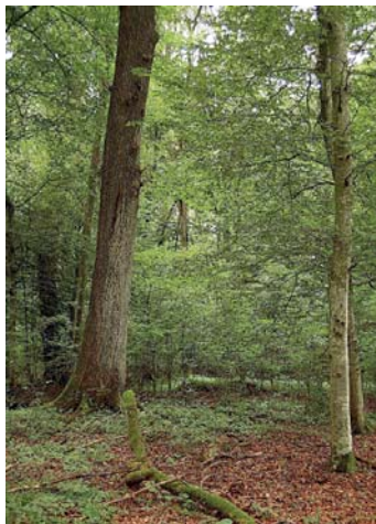
Bild 4. Zielarten wie die Eichen-Stabflechte ( Bactrospora dryina ) sind auf einen intakten Auen-Lebensraumverbund angewiesen.

wir die populations- und landschafts-genetischen Forschungskonzepte auf die Lebensgemeinschaften der Hartholzauen übertragen. In den Untersuchungsgebieten charakterisieren wir die Metapopulationen der ausgewählten Zielarten und untersuchen die genetische Diversität der einzelnen Populationen sowie den Genfluss zwischen Populationen in Abhängigkeit von Habitatsgrösse, Habitatsqualität und Vernetzungsgrad. Aus den Untersuchungen lässt sich ableiten, unter welchen Bedingungen Zielarten sich etablieren und langfristig überleben können. Die Erkenntnisse liefern wissenschaftliche Grundlagen für die Dimensionierung von Revitalisierungen, welche die konkrete Förderung von Auen-Zielarten ermöglichen.