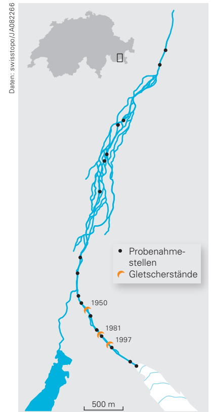
Das Untersuchungsgebiet am Rosegbach unterhalb des Tschiervagletschers mit den Probenahmestellen sowie früheren Ständen der Gletscherzunge.