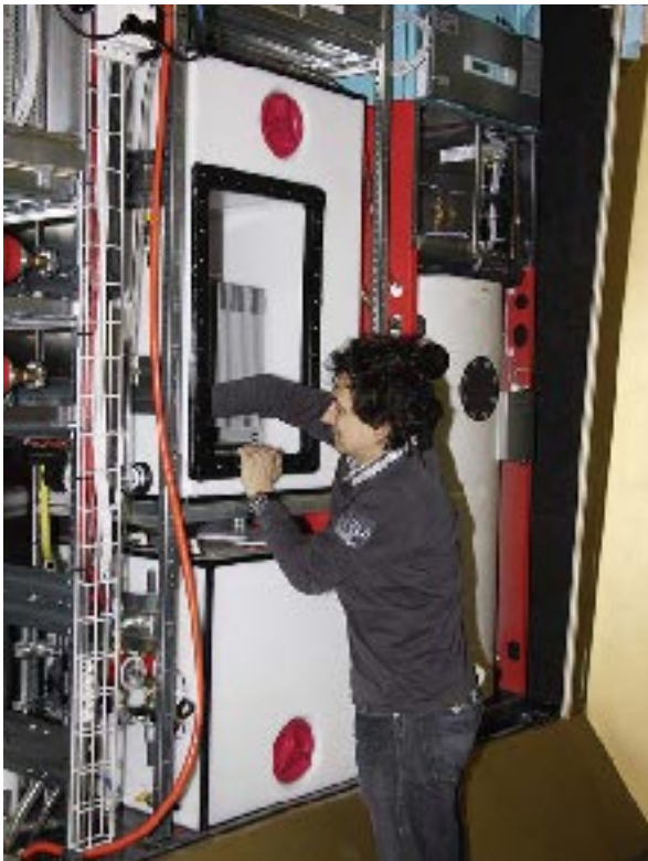
Links: Montage der Kleinkläranlage über dem Brauchwasserspeicher im engen Technikraum des Wohncontainers Self. Mitte: Membranmodul für die Trinkwasseraufbereitung aus Dach- bzw. Regenwasser. Rechts: Membranmodul für das Grauwasserrecycling.

Aufgrund ihrer Einfachheit eignet sich die Niederdruck-Ultrafiltration insbesondere für die dezentrale Wasseraufbereitung in Entwicklungsländern. Weltweit haben mehr als 900 Millionen Menschen noch immer keinen Zugang zu hygienisch einwandfreiem Trinkwasser, was