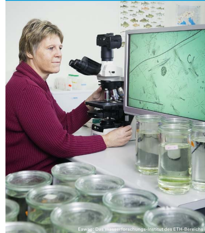
Eawag: Das Wasserforschungs-Institut des ETH-Bereichs

Dienstag, 22. Juni 2010, 9.30 bis 16.30, Auditorium Maximum der ETH Zürich