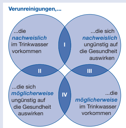
Abb. 3: Stufe 1 aus dem Priorisierungsverfahren für Trinkwasserverunreinigungen in den USA [1].