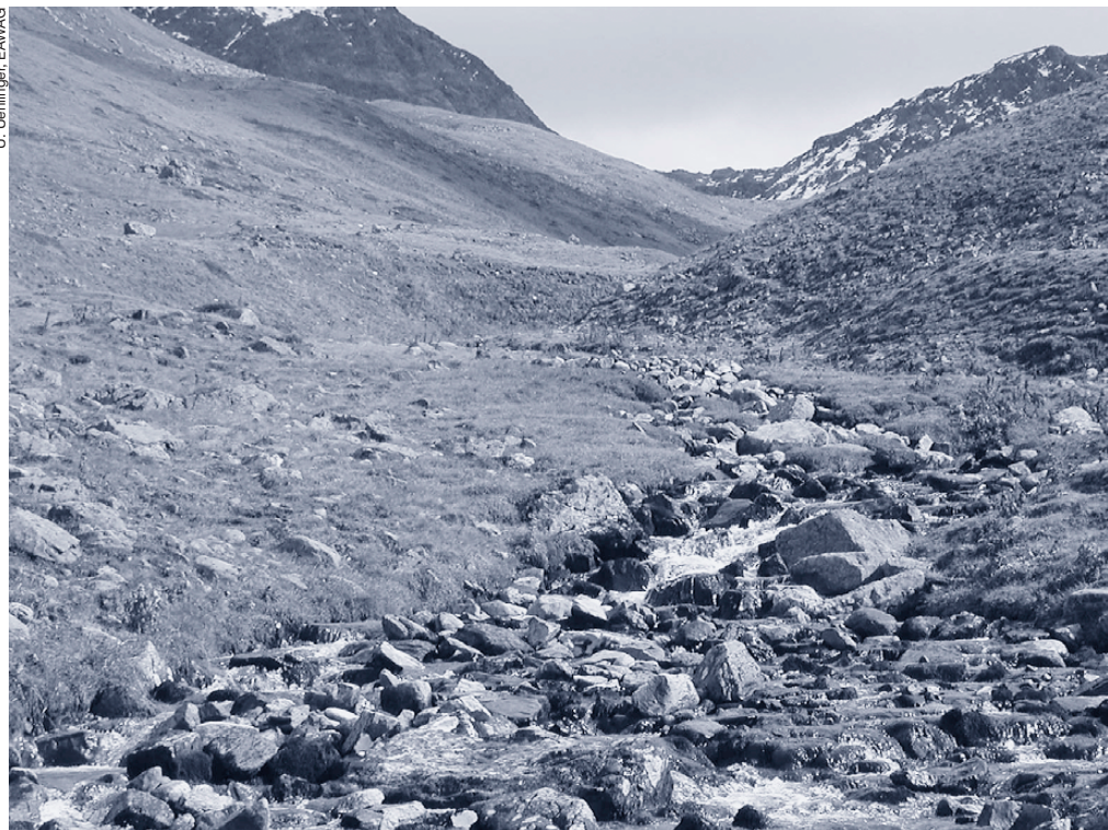
Alpiner Bach im Val Muragl.