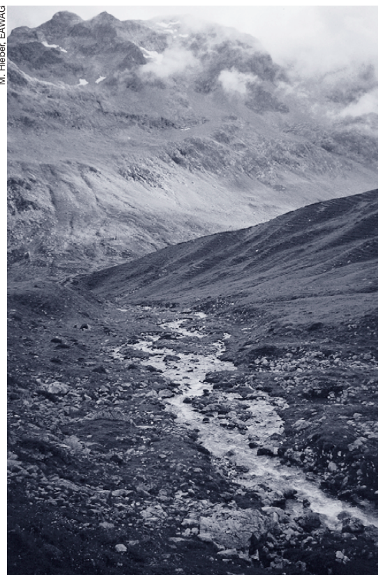
Die Guglia am Julierpass.

einige ökologische Studien, die von anderen europäischen Forschungsgruppen in den letzten Jahren durchgeführt wurden [9, 10].