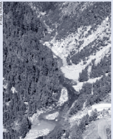
Der stark beeinträchtigte Spöl bei Restwasserabfluss.

parkforschung hoffen wir, dass die EAWAG ihr heutiges Engagement in der Gewässerforschung im Nationalpark weiterführt und damit zum Erkennen langfristig wirksamer Prozesse beitragen hilft.