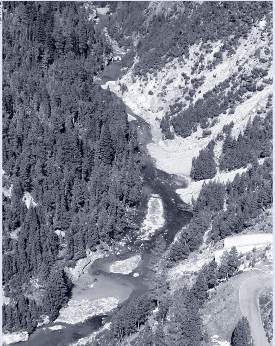
Le Spöl fortement perturbé en régime d'écoulement résiduaire.

genre d'expérimentations étant donné que seuls les aspects de production d'électricité et de protection de l'environnement doivent être pris en compte. Les premiers résultats indiquent qu'une à deux petites crues par