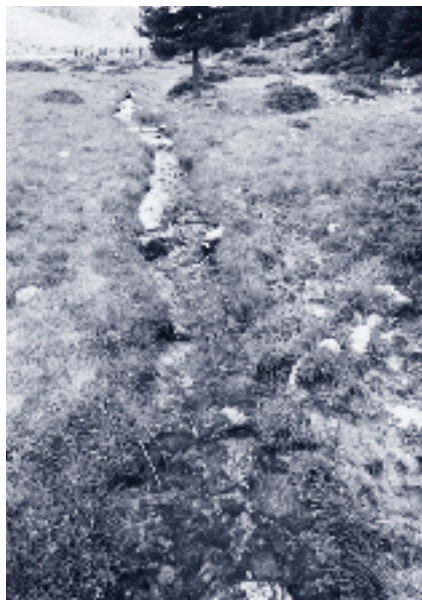
Chenal alimenté par les eaux souterraines.