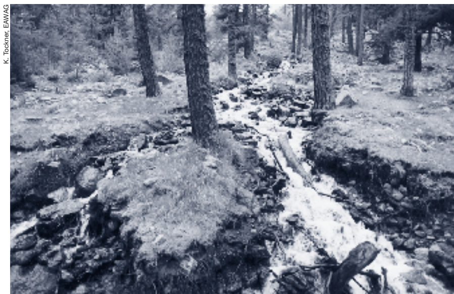
Affluent du Roseg.

sonnier de la part relative des différentes sources d'eau contribue dans la plaine alluviale haute-alpine du Val Roseg à une remarquable hétérogénéité.