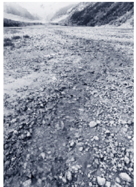
Chenal connecté de façon intermittente.