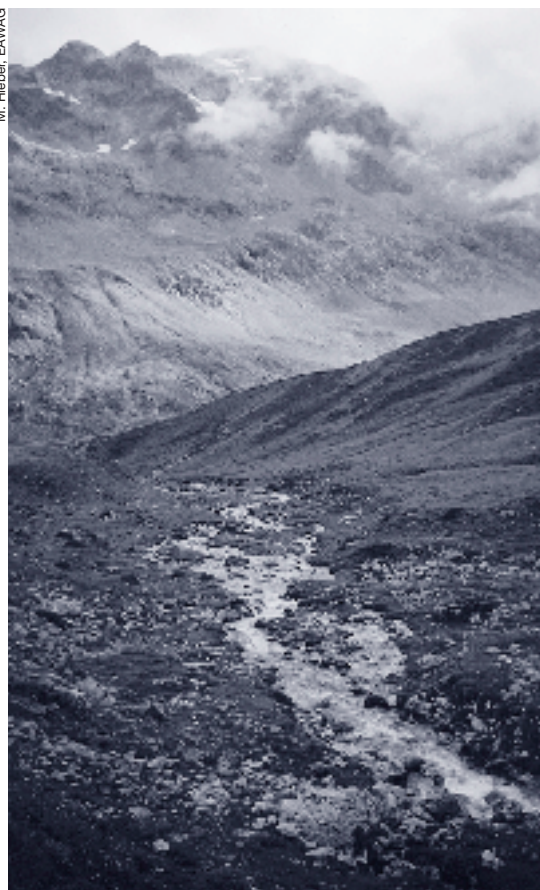
La Guglia près du Julierpass.

l'écologie des cours d'eau alpins au moment de rédiger une revue sur le sujet en 1994 [6]. Cet état des choses contrastait fortement avec l'abondance des connaissances rassemblées sur la climatologie, la glaciologie, l'hydrologie et l'écologie des milieux terrestres de l'étage alpin [2, 4]. A cette époque, les études menées sur l'écologie des torrents alpins étaient générale-