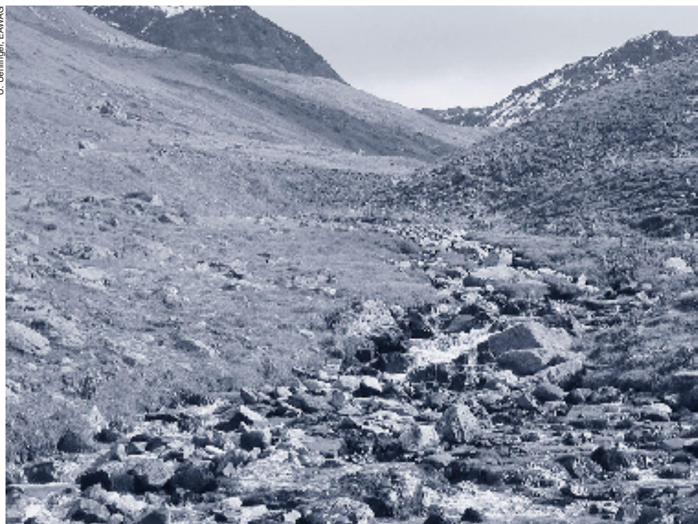
Cours d'eau alpin dans le Val Muragl.