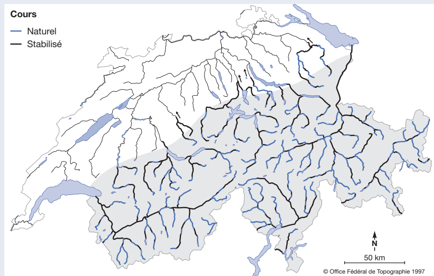
Fig. 2: Cours d'eau alpins au cours corrigé. Adapté de [14].

Pour assurer la protection d'habitations contre les dangers naturels et pour gagner sur les rivières de précieuses terres agri-