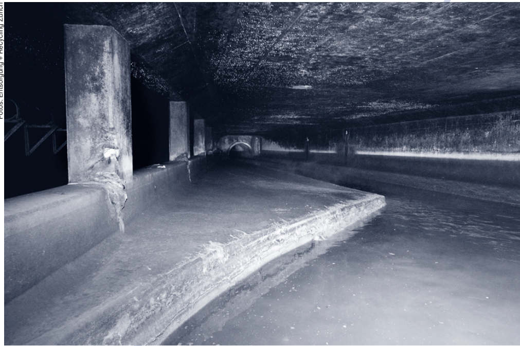
In der Zürcher Unterwelt.

läuft, bevor es versickert. Diese zum Teil enormen und gegenüber dem häuslichen Abwasser andersartigen Verunreinigungen stellen die Siedlungsentwässerung vor neue Probleme. Zentrale Grössen in diesem Zusammenhang sind das Wissen um die entsprechenden Stoffflüsse, die Dynamik der Schmutzstoffe und die Leistungen der Barrierensysteme zum Schutz von Gewässer, Grundwasser und Boden (siehe Artikel von M. Boller, S. 24).