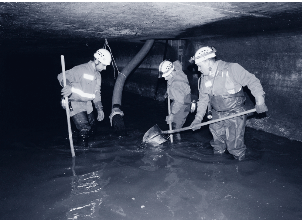
Travaux d'entretien dans les égouts effectués par des employés de «Entsorgung + Recycling Zürich».