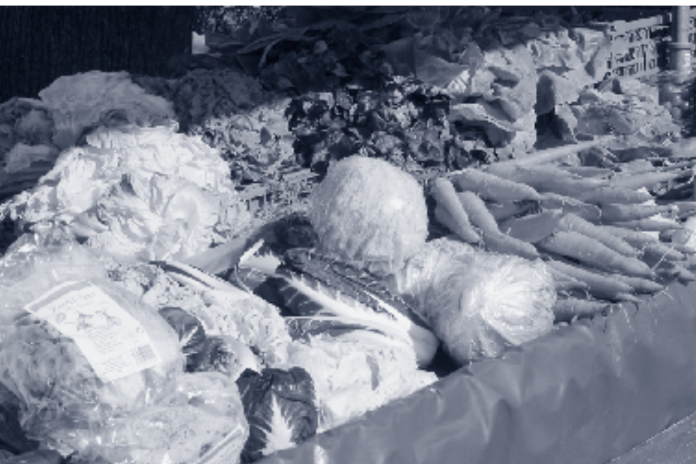
Y. Lehnhard, EAWAG

A l'aide des WC NoMix, des toilettes de construction particulière, il est possible de collecter les urines de manière assez facile pour les stocker dans un réservoir spécial et les acheminer vers la station d'épuration au moment le plus propice, que ce soit par les égouts existants ou par un camion spécial. La technologie NoMix peut d'autre part être complétée de dispositifs spéciaux de traitement des urines (Tab. 1). De tels dispositifs seraient particulièrement intéressants car ils permettraient une élimination plus facile des micropolluants. De plus, les urines brutes pourraient être transformées en fertilisant qui pourraient être utilisés en agriculture à la place des engrais chimiques. La version A de la technologie NoMix, c'est-à-dire la collecte séparée des urines et l'épandage des urines stockées à des fins de fertilisation, est déjà employée à l'heure actuelle. Les versions B et C sont, quant à elles, nouvelles mais elles peuvent être facilement