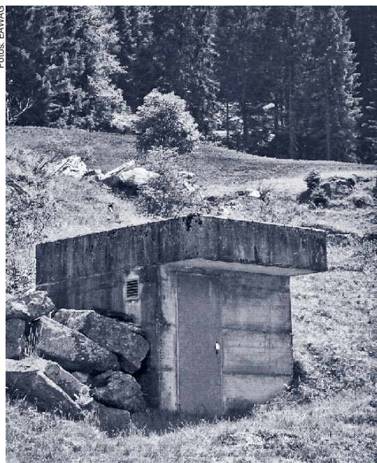
Abb. 3: Gülleaustragung und ...