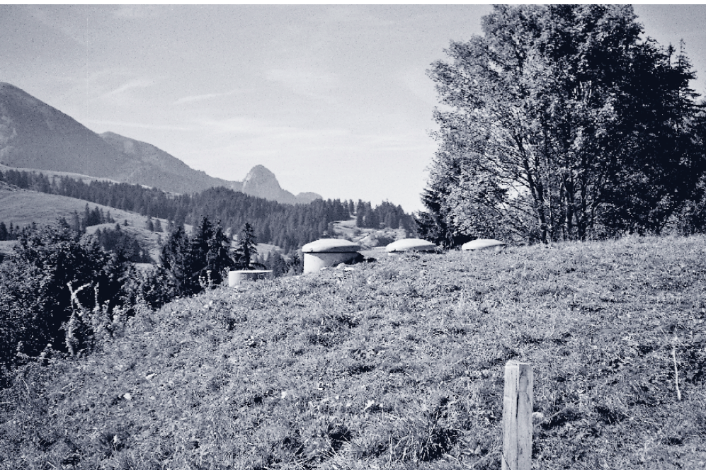
... Weidebewirtschaftung bis an Trinkwasserfassungen heran können zu tierfäkalischen Verunreinigungen führen.

erkrankten Durchfallpatienten zu einem bestimmten Zeitpunkt, liegt in Deutschland und der Schweiz für die Allgemeinbevölkerung bei 0,4–1,9%. Kinder sind stärker betroffen, hier liegt die Rate bei 1,1–4,8%, und bei Aidspatienten steigt sie sogar auf 11,8% an. Man rechnet in der Schweiz jährlich mit etwa 340 Kryptosporidiosefällen [8]. Tatsächlich werden aber nur sehr wenige Fälle klinisch festgestellt. Dies könnte folgende Gründe haben: