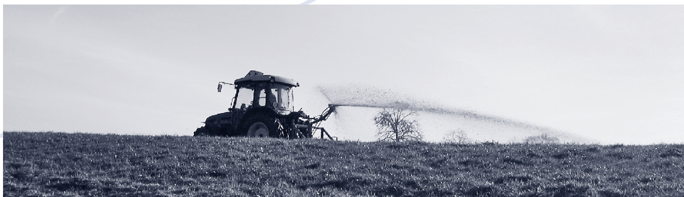
Zur Ertragssteigerung werden dem Boden gezielt Nährstoffe zugeführt, wobei ein Teil davon ungenutzt in der Umwelt verloren geht.