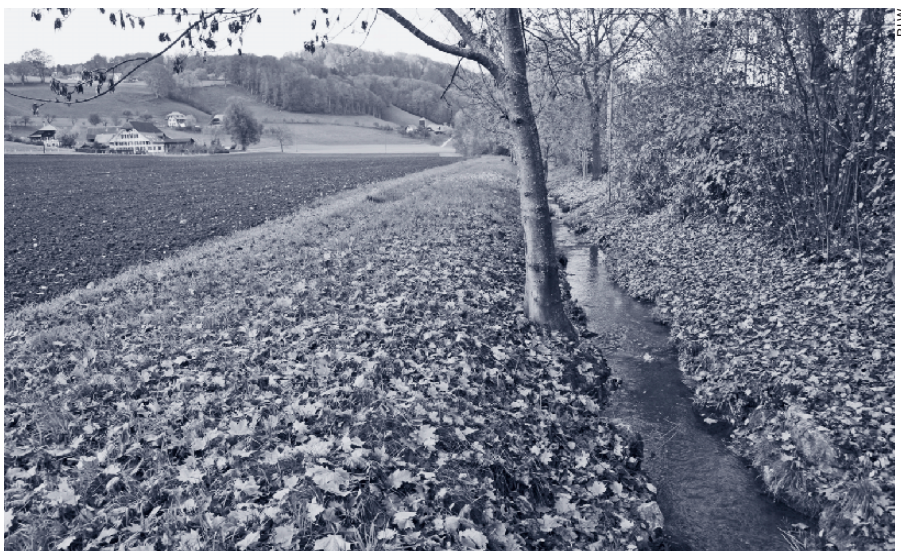
Abb. 1: Ein 3 m breiter Grünstreifen vermindert den Eintrag von Düngern und Pflanzenschutzmitteln in die Gewässer. Worble im Kanton Bern.

zern, Solothurn, Schaffhausen, Waadt und Zürich. Weitere Nitrat- und Phosphorprojekte sowie ein Pflanzenschutzmittelprojekt in der Westschweiz sind in Planung.