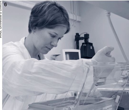
IRAS, Université d'Utrecht