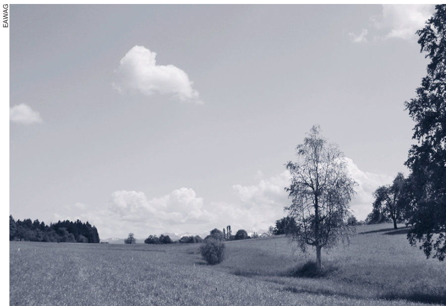
Parcelle expérimentale occupée par une prairie permanente.

La figure 1 indique la teneur en sulfaméthazine du sol avant et après les deux épandages de lisier. Les valeurs représentées correspondent à la valeur moyenne sur l'ensemble de la parcelle aux différentes dates. Etant donné l'hétérogénéité du terrain, il faut s'attendre à observer localement des concentrations jusqu'à cinq fois supérieures à la moyenne. Avant la première application, le sol était exempt de sulfaméthazine. Après ce premier épandage de lisier, la concentration a brusquement augmenté pour rechuter