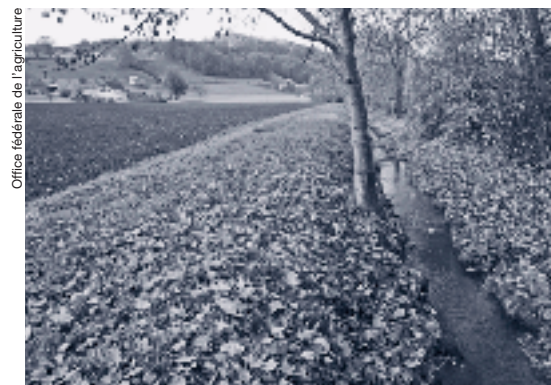
Fig. 1: Une bande herbeuse de 3 m de large permet de limiter l'entraînement vers les eaux des fertilisants et produits phytosanitaires. Worble, canton de Berne.

Les premiers projets pilotes engagés au sens de l'article 62a de la Loi sur la protection des eaux sont maintenant en phase terminale. Au bout des 6 ans réglementaires, le bilan est tout à fait positif. Ainsi par exemple, le projet nitrates concernant les abords du captage d'eau potable de Froberg à Wohlenschwil dans le canton d'Argovie a été lancé comme projet pilote en 1996 et bénéficie depuis 2001 du soutien financier de la Confédération. Il concerne un bassin d'alimentation de 102 hectares, dont 62 hectares sont des terrains agricoles que se partagent 12 exploitations. 50 hectares sont concernés par un contrat «eau potable» qui impose des restrictions sévères et pluriannuelles de l'emploi d'engrais minéraux,