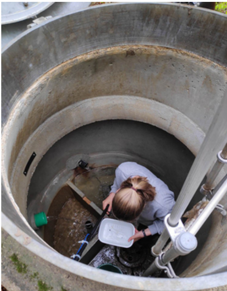
Feldarbeit in einer Grundwasserfassung im Einzugsgebiet der Töss.