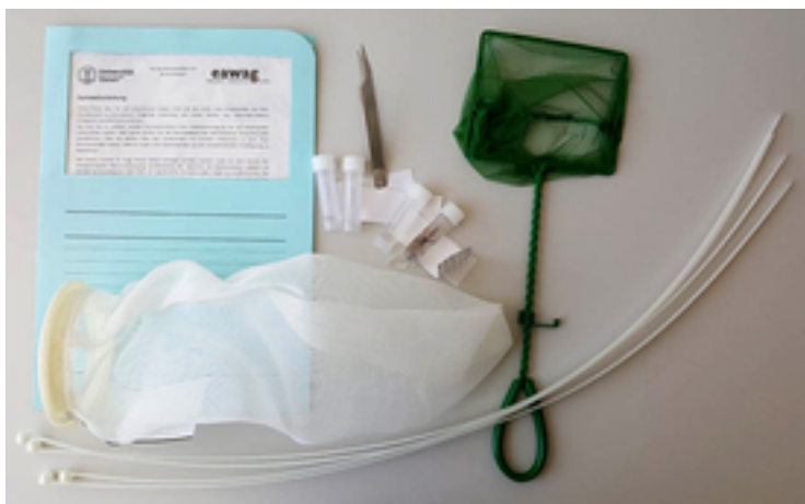
Das Beprobungsmaterial, mit dem am Forschungsprojekt beteiligte Brunnenmeister ausgerüstet wurden.

Der Citizen-Science-Ansatz mit einer ausgewählten Gruppe von Bürgerforschern soll denn auch Bestandteil der bereits geplanten Ausweitung des Projekts sein. In den nächsten Jahren sollen Daten aus mehreren Hundert über die ganze Schweiz verteilten Brunnenstuben gewonnen werden. Ziel ist ein landesweiter Überblick über die Biodiversität im Grundwasser. Neu soll in Zukunft auch die Umwelt-DNA-Methode eingesetzt werden. Dabei reichen zum Beispiel Hautpartikel oder Fäkalien von Lebewesen aus um deren Vorkommen zu dokumentieren.