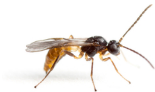
Biologische Waffe gegen Blattläuse: Die Blattlauswespe Lysiphlebus fabarum

Symbiotische Beziehungen als Schutz vor Parasiten und als treibende Kraft für die Evolution: Dieser beschriebene Mechanismus dürfte nicht nur bei Insekten eine Rolle spielen, sondern in der Natur weiter verbreitet sein, als man meint.