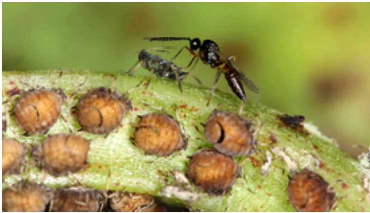
Eine Blattlauswespe attackiert Blattläuse

Vorburger erforscht die Beziehung zwischen Blattläusen und Schlupfwespen schon lange. Seine Forschung reiht sich ein in die Tradition von Wirt-Parasiten-Forschung an der Eawag, die auch Wasserschnecken und Wasserflöhe umfasst. Bisher zu wenig beachtet worden sei jedoch der Aspekt des Dritten im Bunde: der Endosymbionten. «Und insbesondere ihr Einfluss auf die Biodiversität», so Vorburger. Endosymbionten würden nicht nur selber eine Form der Biodiversität darstellen, sondern zusätzlich auch die Entstehung biologischer Vielfalt bei den Schlupfwespen fördern.