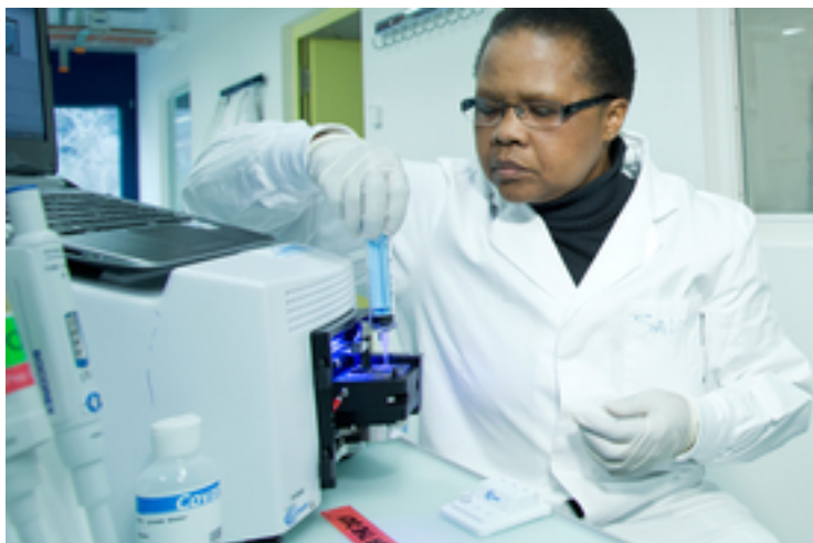
Abb. 4: Im Molekulargenetiklabor der Eawag in Kastanienbaum macht eine Technikerin Sequenzanalysen vom Erbgut verschiedener Fische. Dank der modernen Analytik können Forschende die Artenvielfalt in Seen untersuchen.