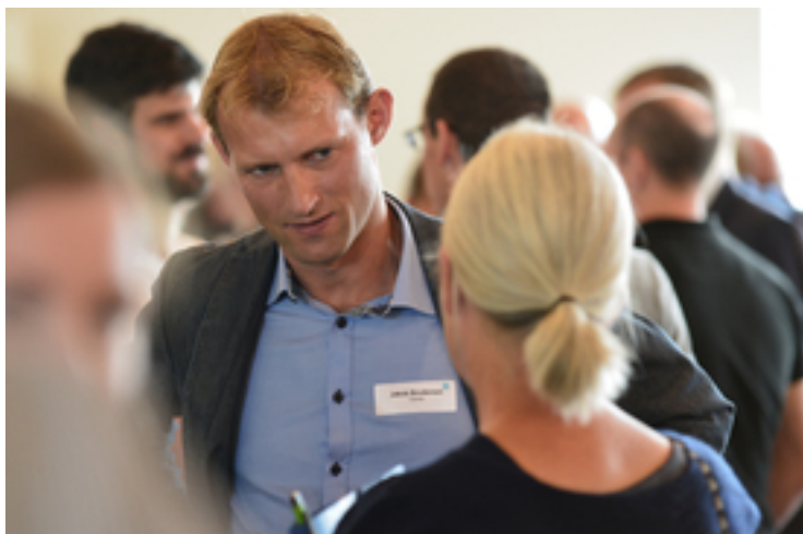
Abb. 5: Den Austausch zwischen Forschenden und den Fachleuten in der Praxis zu pflegen, ist einer der Beweggründe der Eawag, den jährlichen Infotag zu organisieren.