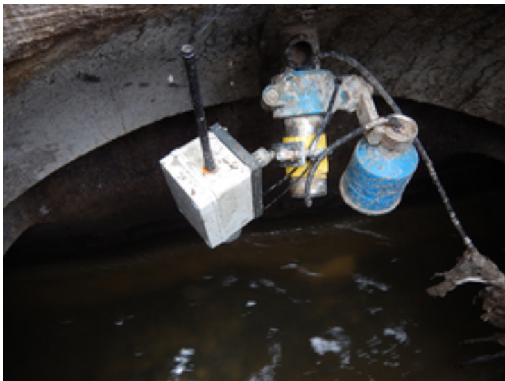
Abb.2.: Die Funksensoren liefern den Forschenden räumlich und zeitlich hochaufgelöste Messungen von Abflüssen und Pegelständen.