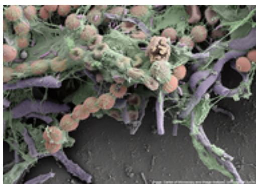
Biofilm aus einer Bade-Ente unter dem Rasterelektronenmikroskop. Die künstliche Einfärbung hebt die verschiedenen Strukturen der Bakterien hervor.