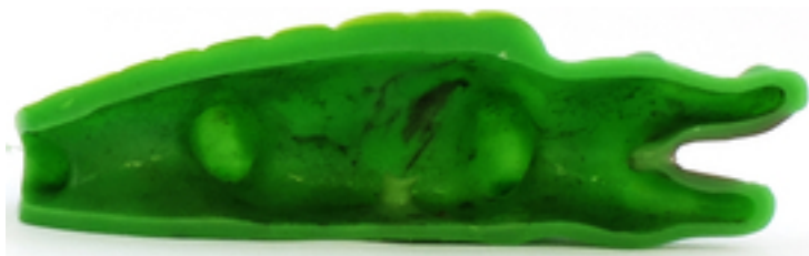
Das Innenleben eines Badekrokodils und eines Gummientchens.