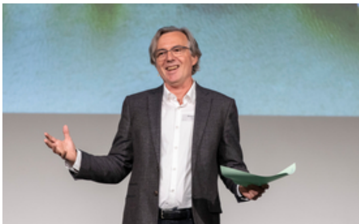
Am Einführungsreferat zum Thema «Gewässer in Zeiten der Energiewende» am Infotag 2019.