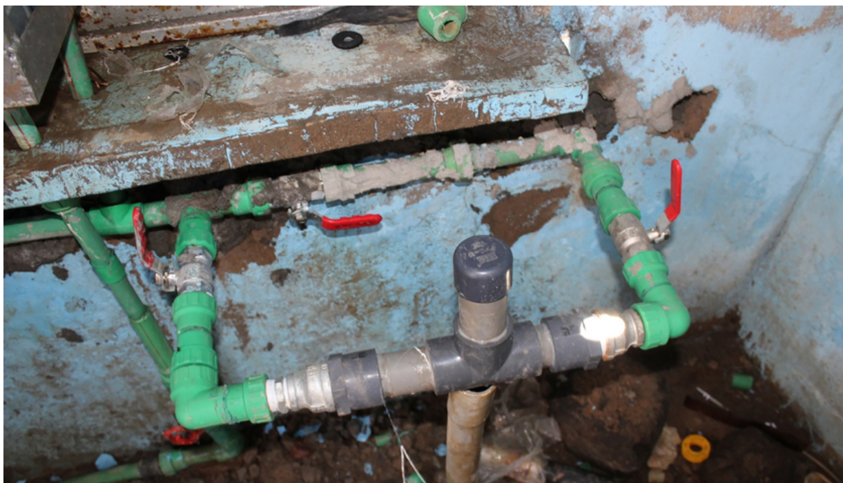
Passive, lokal hergestellte Chlorierungsanlage, die in einem Wasserkiosk in Kenia installiert wurde.

Die am Wasserhahn angebrachte AkvoTur liess sich am schnellsten und am einfachsten installieren. Sie war widerstandsfähig, einfach zu bedienen und verzeichnete eine Dosierkonsistenz von 69%. Die T-Chlorgasdosieranlage erbrachte eine bessere Gesamtleistung. Die Herstellung und Installation war zwar komplizierter, aber sie war widerstandsfähiger und hatte eine höhere Dosierkonsistenz (89%), wenn ein automatischer Abfluss vorhanden war. Durch den automatischen Abfluss kann das Wasser von der T-Chlorgasdosieranlage durch die Schwerkraft abfliessen.