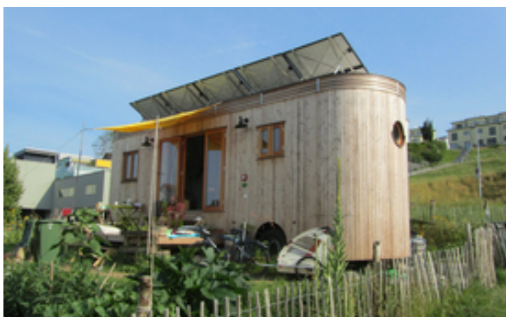
Die autonome Urinbehandlung mit Nährstoffrückgewinnung wird auch im innovativen Tinyhome «Tilla» getestet. Rechts hinten ist klein das Verdunstungsmodul zu sehen.

Nährstoffe können in konventionellen Kläranlagen aus dem Abwasser entfernt, aufbereitet und wieder in regionale Stoffkreisläufe gebracht werden. Doch die Verfahren am Ende der Röhren (end of pipe) erfordern Platz, technischen Aufwand, Energie und Chemikalien. Es ist nicht so, dass dies bei dezentraler oder semi-zentraler Behandlung des Abwassers alles entfällt. Doch eine frühe Trennung der verschiedenen Stoffströme ermöglicht vor allem prozesstechnisch flexiblere Lösungen. Ein Beispiel dafür ist die an der Eawag entwickelte Blue Diversion Autarky Toilette . Sie setzt auf Massnahmen vor Ort und eine Technik, die Abwasser zu nützlichen Produkten macht. Gleichzeitig erforschen und entwickeln die Eawag-Mitarbeitenden mit Autarky eine Plattform, welche moderne On-site-Technik schrittweise in den Badezimmermassstab bringt: Was vor 20 Jahren noch die Vision einiger Pioniere war, ist heute eine interessante Innovation, an der immer mehr Verfahrenstechnikerinnen und -techniker und Firmen mitarbeiten.