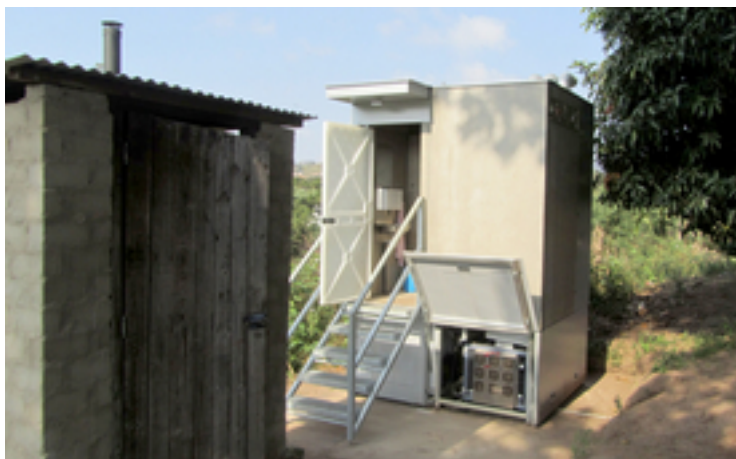
Die Blue Diversion Autarky Toilette im Test am Rand von Durban, Südafrika. Rechts vorne ist das Verdunstungsmodul sichtbar.