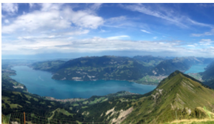
Ausblick auf Thuner- (links) und Brienersee

Im Fachjournal ZooKeys beschreibt ein Team des Wasserforschungsinstituts Eawag und der Universität Bern sieben endemische Felchenarten der Berner Oberländer Seen – vier davon wurden vorher noch nicht wissenschaftlich beschrieben, zwei erst in den letzten Jahren als eigenständige Arten erkannt. Eine Felchenvielfalt wie in Thuner- und Brienersee gibt es in der Schweiz sonst höchstens noch im Vierwaldstättersee; und gerade bei solch tiefen Seen sind weitere Überraschungen nicht auszuschliessen.