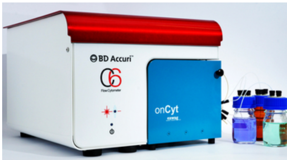
Abb. 2: Vollautomatisiertes Online-Durchflusszytometrie-System bestehend aus einem herkömmlichen Durchflusszytometer (rot-weiss) und dem von der Eawag entwickelten Automationsmodul (blau).

Statt von Hand jede einzelne Probe ins DZ-Messgerät einzuspeisen, erledigt nun eine daran gekoppelte Einheit alles autonom, von der Probenahme über die Probenvorbereitung mit dem Anfärben der DNA/RNA bis zur Reinigung des Geräts. Das vollautomatische Messsystem kann nun direkt vor Ort, zum Beispiel an einer Quelle oder einer Wasseraufbereitungsanlage, installiert werden und dort über Monate zeitlich hochaufgelöste Messreihen der Bakterienkonzentration liefern. Damit stehen zum ersten Mal zehntausende Messdaten zur mikrobiologischen Wasserqualität zur Verfügung – ein bisher unmöglicher Reichtum an Information.