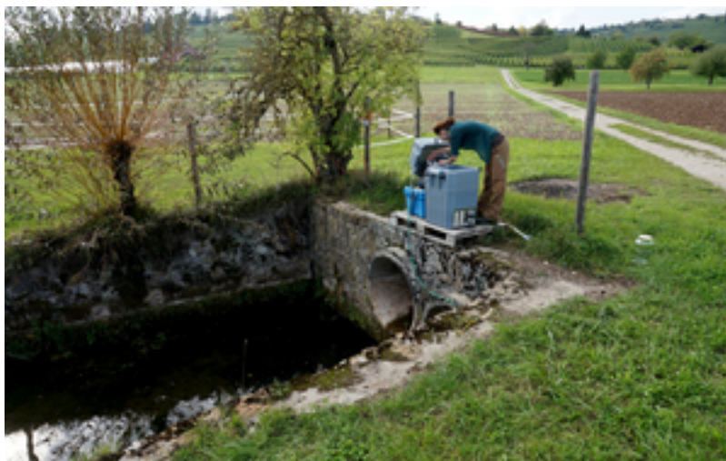
Probenahmen am Hoobach