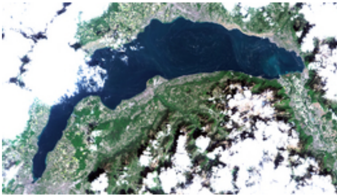
Titelbild in grosser Auflösung zum Download