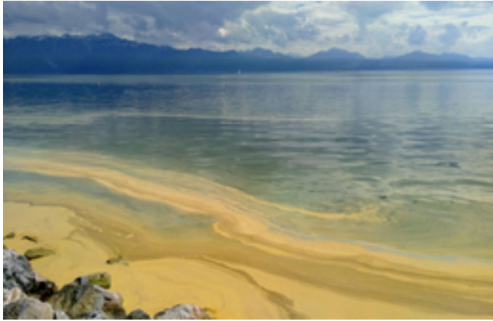
Pollenteppich auf dem Genfersee vor Lausanne.