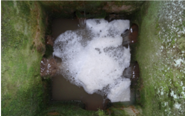
Hier fliesst Wasser von mehreren Einlaufschächten zusammen und dann direkt in den nahen Bach.