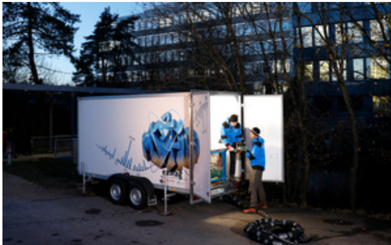
Das mobile Wasserlabor im Test am Chriesbach vor der Eawag in Dübendorf.

klar, dass die kurzzeitigen Konzentrationsspitzen ökotoxikologisch bedeutend sind: So wurde das in der Gewässerschutzverordnung verankerte Qualitätskriterium, das eine akute Schädigung von Gewässerorganismen verhindern soll, mehrmals und um ein Vielfaches (bis zu 30-fach) überschritten. Für viele Pestizide übertrafen die Höchstkonzentrationen der 20minütigen MS2field-Messungen die Konzentrationsmittelwerte wie sie mit den 3.5-Tagesmischproben ermittelt wurden bis um das 170fache.