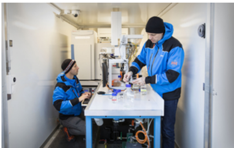
Blick ins Innere des Messanhängers.

Automatisiert, mobil, präzise «MS2field» hat das interdisziplinäre Eawag-Team sein fahrbares Wasserlabor getauft. «MS» steht für das in der Messplattform verbaute Massenspektrometer und mit dem Zusatz «to field» wird auf den flexiblen Einsatz draussen, im Feld, auf einer Kläranlage oder an einem Gewässer hingewiesen. Nebst dem Massenspektrometer als Herzstück, besteht das System aus einer automatischen, kontinuierlichen Probenahme und Filtration, einem Probeanreicherungsmodul und einem Flüssigchromatographen. Schliesslich werden die Daten auch automatisiert ausgewertet und verschlüsselt via Mobilfunknetz an einen Eawag-Server übermittelt. Zurzeit ist einmal pro Woche eine Kontrolle und Wartung des Systems nötig.