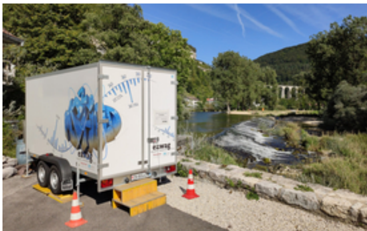
Das MS2field im Einsatz in Saint-Ursanne (JU).

Bei einem ersten Testlauf im Februar 2019 untersuchte das Team um Ort und Singer Abwasser der Kläranlage Fehraltorf im Kanton Zürich. Dabei analysierten sie während vier Wochen über zweitausend Proben des Rohabwassers und deckten Schwankungen und Tagesverläufe auf, die man so bisher nicht kannte. «Mit konventioneller Probenahme und -aufbereitung hätte das mehrere Monate gedauert», sagt Ort.