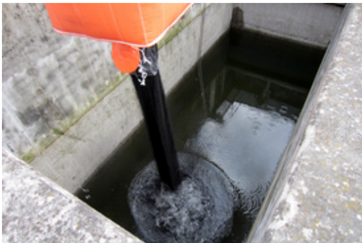
Für Versuche der Eawag wird eine Sandfilterzelle der ARA Bülach statt mit Sand mit granulierter Aktivkohle beschickt.