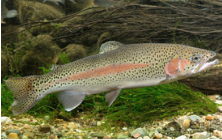
Die verwendeten Zellen stammen von der Regenbogenforelle.