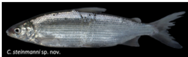
Zu Ehren des Felchenforschers Paul Steinmann gaben die Forschenden dem 2018 im Thunersee entdeckten «Balchen2» nun den wissenschaftlichen Namen Coregonus steinmanni .