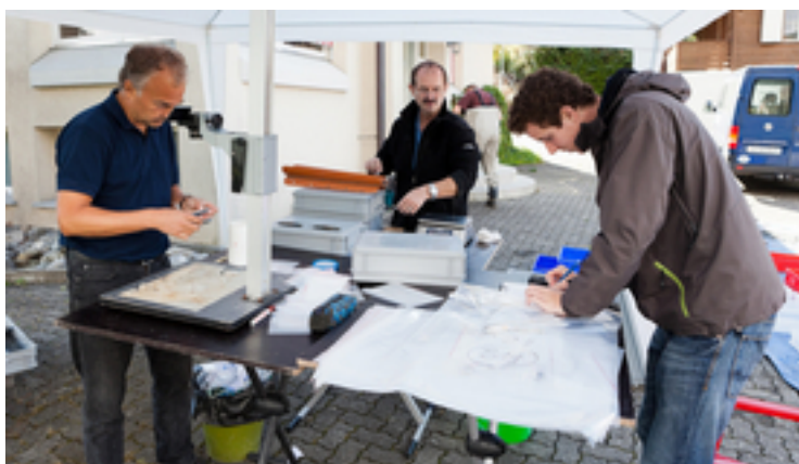
Vermessen, wägen, fotografieren, beschreiben – im Rahmen des «Projet Lac» wurden die Fische der Schweizer Seen erstmals systematisch inventarisiert.

Umfangreiche Beschreibung Für die neuen wissenschaftlichen Beschreibungen verwendeten die Biologen sowohl neue als auch historische Fischpräparate. Die «neuen» Fische kamen zum Teil aus den Fängen von Berufsfischern. Der Grossteil wurde im Rahmen der Projekte gefangen, welche die Eawag und die Universität Bern in den letzten Jahren durchführten; so stammen einzelne Präparate aus dem Projet Lac , die meisten aus einer umfangreichen Befischung eines Tiefengradienten auf den Laichplätzen während der gesamten Laichzeit der verschiedenen Arten. Diese Präparate verglichen die Fischbiologen mit bis zu 150jährigen Exemplaren aus dem Naturhistorischen Museum Genf und aus der Eawag-Sammlung von Paul Steinmann, die seit kurzem vom Naturhistorischen Museum Bern kuratiert wird. Beschrieben wurden morphologische Merkmale – zum Beispiel die Anzahl und Form der Kiemenreusen, die viel über die Nahrung einer Fischart aussagt. Zur Beschreibung gehören weiter die Resultate der genetischen Untersuchungen und Angaben zur Ökologie der Fische, insbesondere zu ihrem Fress- und Laichverhalten Die Eawag revidiert gegenwärtig im Auftrag des Bundesamtes für Umwelt BAFU die Taxonomie der Felchen in der Schweiz. Nach der wissenschaftlichen Publikation zu den Berner Oberländer Felchen folgen in nächster Zeit weitere zu Vierwaldstätter-, Zuger-, Sempacher- und Sarnersee.