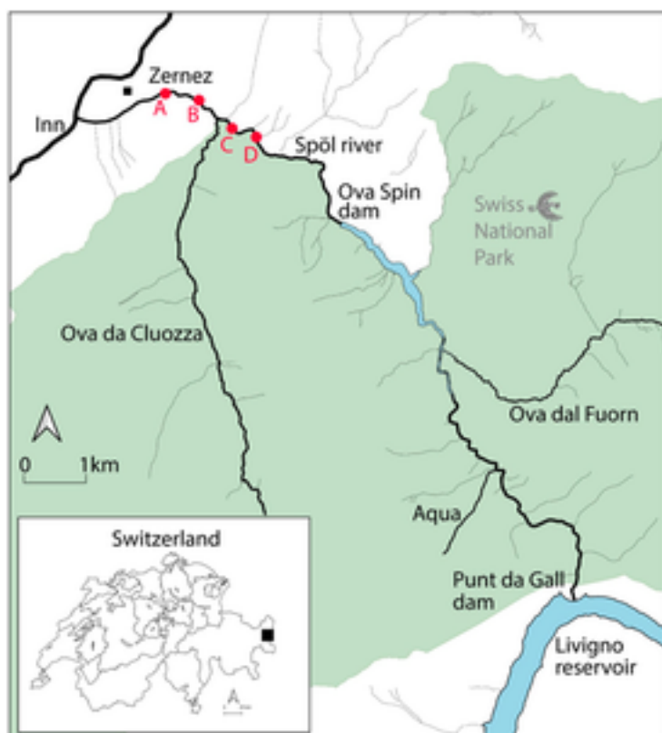
Abbildung 1. Lage des Untersuchungsgebiets sowie der Talsperren «Punt da Gall» und «Ova Spin». Die

Das Einzugsgebiet des Spöl entspringt in den Zentralalpen und ist Teil des Donaueinzugsgebiets (Abbildung 1). Zwei grosse Talsperren (Punt da Gall und Ova Spin) wurden zwischen 1960 und 1970 zur Stromerzeugung gebaut und regulieren den Abfluss des Spöls. Der frei fliessende Nebenfluss «Ova da Cluozza» mündet auf halber Strecke zwischen dem Staudamm Ova Spin und der Einmündung in den Inn bei Zernez in den Spöl. Die Wasserstände des Ova da Cluozza schwanken je nach Jahreszeit erheblich, einschliesslich niedriger Wasserstände im Winter und periodischer Überschwemmungen durch Regenfälle oder Schneeschmelze, die an den Spöl vor dem Talsperrenbau erinnern.