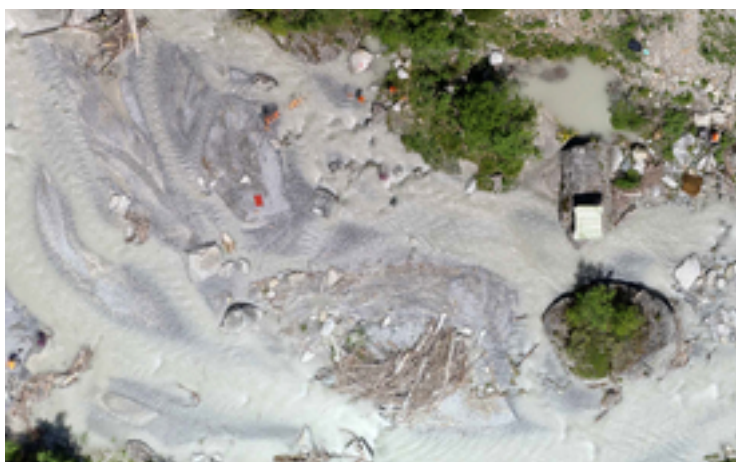
Abbildung 2. Luftbild des Flusses Spöl an der Einmündung des Nebenflusses «Ova da Cluozza» am 19. Juli 2019. Man sieht Geomorphologen in orangefarbenen Jacken, die eine Untersuchung zum Thema «Sedimenttransport» durchführen.

Künstliche Hochwasser, d. h. kontrollierte Abflüsse von Wasser aus den beiden Talsperren, wurden im Jahr 2000 eingeführt und treten ein bis zwei Mal pro Jahr auf. Wir untersuchten den Spöl flussaufwärts und flussabwärts der Einmündung des Nebenflusses «Ova da Cluozza» im Anschluss an künstliche Hochwasser am 4. September 2018 und am 19. Juli 2019. Die Idee war, die Auswirkungen zwischen einem Flussabschnitt mit stabilen Bedingungen (oberhalb des Nebenflusses) und einem dynamischeren, durch periodische natürliche Hochwasser beeinflussten Abschnitt (unterhalb des Nebenflusses) zu vergleichen. Jedes Hochwasser dauerte acht Stunden, mit einem Spitzendurchfluss von 25 Kubikmetern pro Sekunde für etwa zwei Stunden. Wir haben vor, während und nach den Flutungen verschiedene Aspekte der Wasserqualität, der Sedimente im Flussbett, der organischen Substanz und der Wasserinsekten (Makroinvertebraten) beprobt. Ausserdem führten wir Drohnenuntersuchungen des Flusses durch und nahmen hochauflösende Bilder auf, anhand derer wir etwaige Veränderungen der Flussmorphologie beurteilen konnten (Abbildung 2).