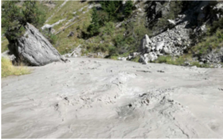
Abbildung 3. Stark getrübbtes Wasser während des künstlichen Hochwassers am Standort D am 4. September 2018.

Nach dem Hochwasser wurden flussabwärts des Nebenflusses (Standorte A und B) keine signifikanten Veränderungen bei der Anzahl (Dichte) und Vielfalt (Taxa-Reichtum) der Makroinvertebraten festgestellt. Oberhalb der Einmündung (Standorte C und D) wurde jedoch ein signifikanter Rückgang der Dichte und des Taxa-Reichtums festgestellt, der sich dann nach etwa vier Wochen wieder erholte. Dieses Ergebnis bestätigte unsere Erwartung, dass die Hochwasser oberhalb des Nebenflusses grössere Störungen im System verursacht haben. Beide Hochwasser spülten den Fluss von Algen und organischem Material im Flussbett frei, wodurch sich die Werte an den Standorten flussaufwärts und flussabwärts verringerten.