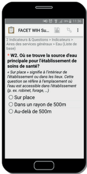
Fig. 1: FACET interface utilisateur

L'outil d'évaluation des installations WASH dans les institutions (FACET), se fonde sur des indicateurs reconnus mondialement et s'inscrit dans le continuum des actions humanitaires et de développement. FACET est un outil simple d'utilisation et facilement adaptable permettant une collecte de données mobiles à la fine pointe de la technologie sur les services d'approvisionnement en eau, les installations sanitaires et les conditions d'hygiène (WASH) dans les écoles, ainsi que la gestion des déchets médicaux dans les établissements de soins de santé. Les données collectées peuvent ensuite être analysées à l'aide d'outils d'analyse standards en ligne ou hors ligne. Un guide d'utilisation explique en détail l'utilisation, les principes de fonctionnement et les caractéristiques de l'outil, ainsi que la façon de l'adapter aux contextes locaux.