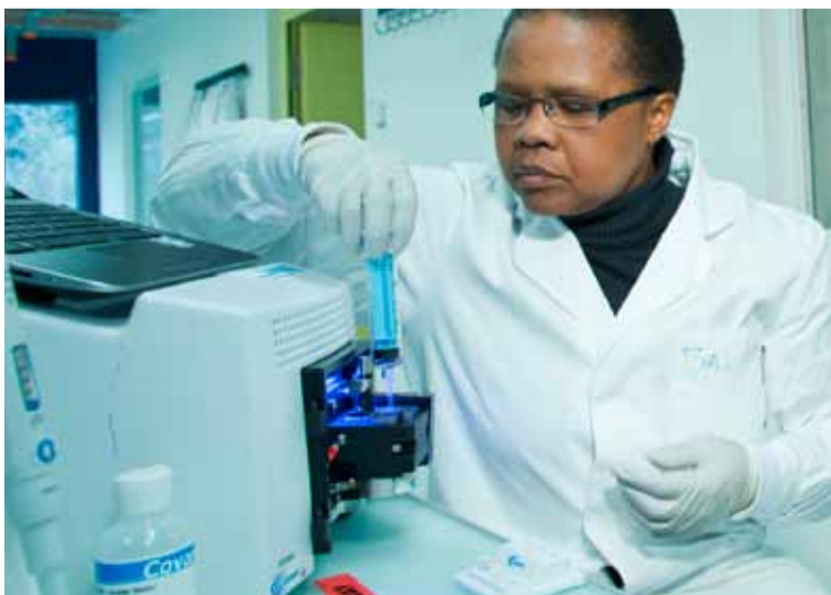
Abb. 4: Im Molekulargenetiklabor der Eawag in Kastanienbaum macht eine Technikerin Sequenzanalysen vom Erbgut verschiedener Fische. Dank der modernen Analytik können Forschende die Artenvielfalt in Seen untersuchen.