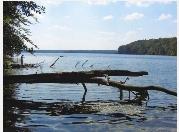
Der am besten untersuchte See bezüglich thermischer Verunreinigung: Stechlinsee in Norddeutschland

Der Stechlinsee in Deutschland (Oberfläche: 4,25 km 2 , maximale Tiefe: 68 m, Volumen: 0,1 km 3 ) ist ein See, der von 1966 bis 1989 für die Kühlung eines Kernkraftwerks genutzt wurde. Aus dem benachbarten Nehmitzsee wurden rund 300 000 m 3 /Tag Kühlwasser entnommen und um ~10 °C erwärmt in den Stechlinsee oberflächlich eingeleitet [34]. Dank zahlreicher Studien über die Auswirkungen dieser Nutzung ist der Stechlinsee der am besten untersuchte Fall einer thermischen Verunreinigung eines Sees.