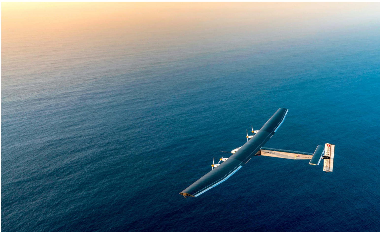
Fig. 1 : Solar Impulse a fait le tour du monde avec le soleil pour seule source d'énergie, démontrant tout le potentiel d'innovation des technologies propres. Pour les pays comme la Suisse, il est économiquement plus intéressant d'investir dans la recherche et développement dans le domaine photovoltaïque que de produire des panneaux solaires.

Les différentes branches de l'industrie ont besoin d'un contexte taillé sur mesure pour être porteuses d'innovation technologique. Les spécialistes des sciences sociales de l'Eawag ont élaboré un concept décrivant les moteurs significatifs de l'innovation et permettant par là même d'identifier les facteurs inhibiteurs et de développer des programmes d'encouragement spécifiques. Texte : Andres Jordi