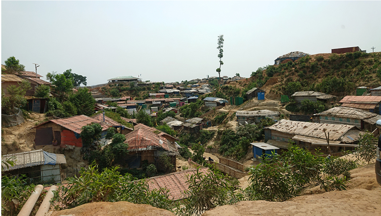
Camp de Rohingya, Cox's Bazar, Bangladesh.