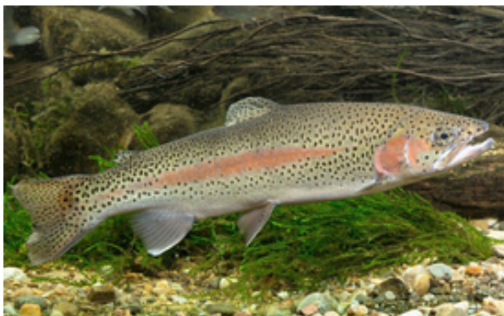
Les cellules utilisées sont originaires de la truite arc-en-ciel.