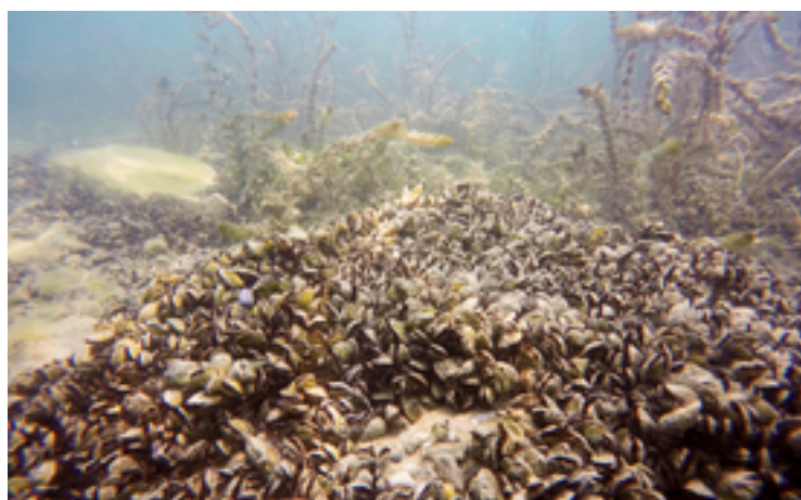
Photo de couverture: Moules quagga dans le Léman.

Haltiner L, Zhang H, Anneville O, De Ventura L, DeWeber JT, Hesselschwerdt J, Koss M, Rasconi S, Rothhaupt K-O, Schick R, Schmidt B, Spaak P, Teiber-Siessegger P, Wessels M, Zeh M, Dennis SR (2022) The distribution and spread of quagga mussels in perialpine lakes north of the Alps. Aquatic Invasions 17 (in press), https://doi.org/10.3391/ai.2022.17.2.02