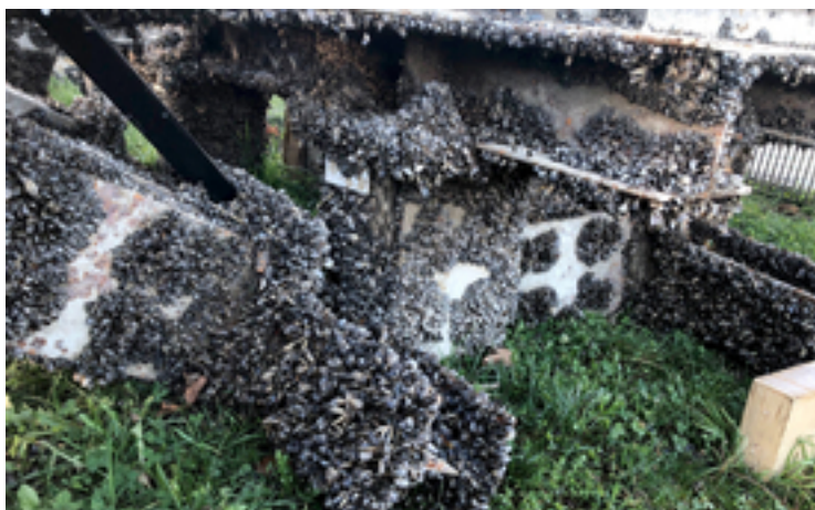
La moule quagga se sent bien dans l'eau sur presque toutes les surfaces: ici sur des pilotis de la scène lacustre de Bregenz.