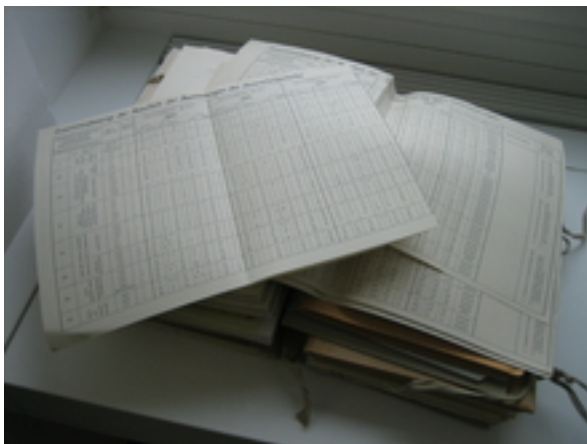
Analyse des données relatives à la concentration en oxygène dissous d'un captage.