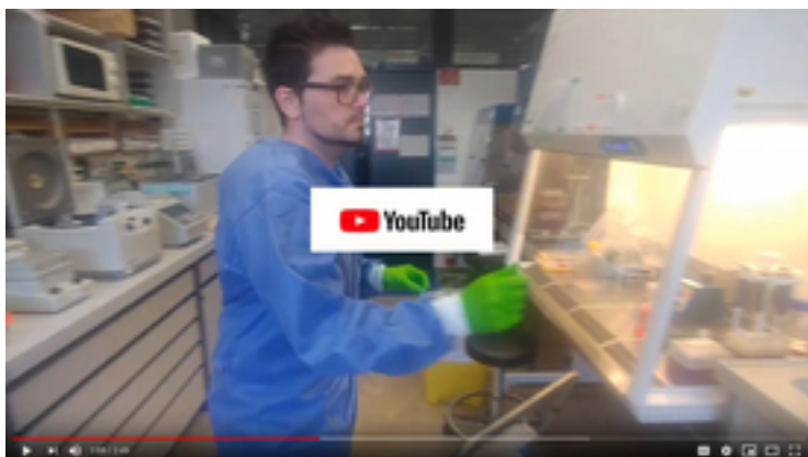
Vidéo du projet (EPFL/Eawag)