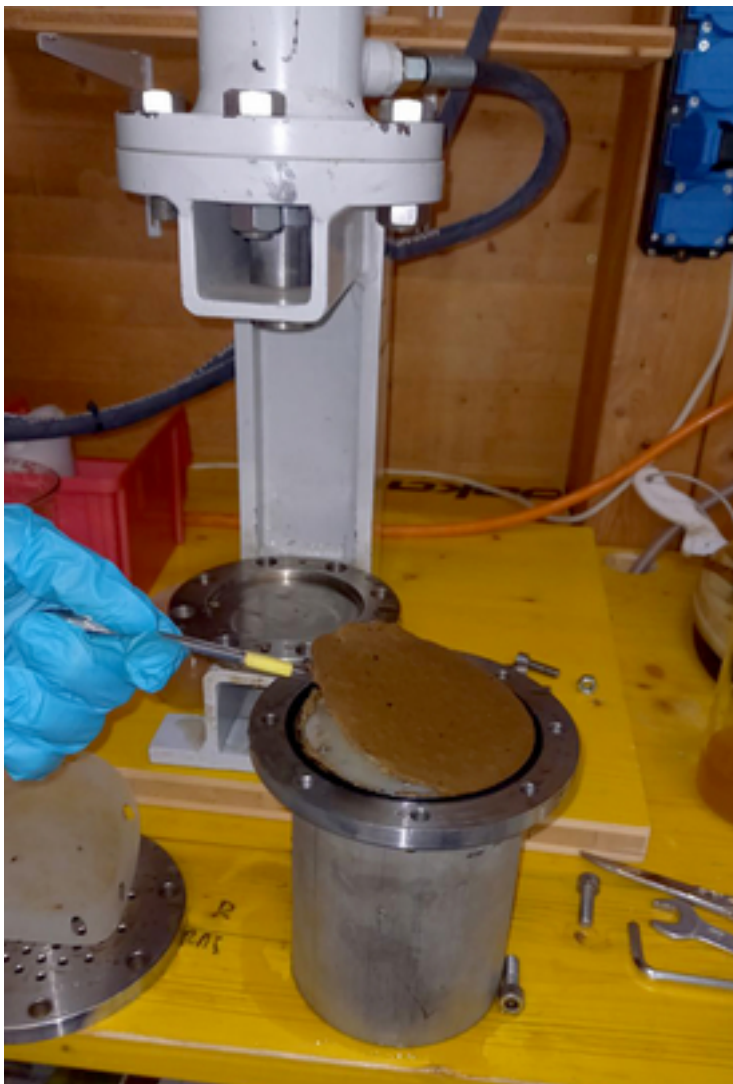
Des tests sous presse permettent d'étudier à quel point les eaux noires peuvent être déshydratées. Après compression, le taux de matières solides est d'environ 25 pour cent.