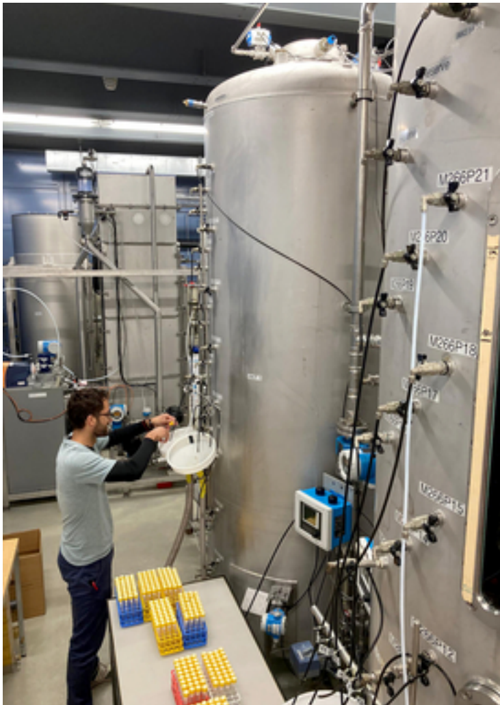
Colonne de filtration dans le laboratoire de l'Eawag (à gauche) et à l'échelle pilote dans la station de conditionnement de l'eau du lac du Service des Eaux de la ville de Zurich WVZ (à droite).