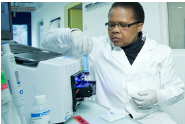
Fig. 4 : Au laboratoire de génétique moléculaire de l'Eawag à Kastanienbaum, une technicienne effectue le séquençage de l'ADN de différents poissons. Grâce aux techniques

L'ichtyobiologiste Jakob Brodersen et son équipe ont implanté des microchips dans plus de 5000 truites de lac pour suivre leurs migrations entre le lac des Quatre-Cantons et ses affluents. Les chercheurs peuvent ainsi déterminer à quel moment les truitelles quittent leur ruisseau de naissance pour rejoindre le lac et à quel moment les adultes repartent vers les frayères. Les premiers résultats montrent que la part d'individus migrant varie entre 5 et plus de 50 % selon les populations. La date de migration peut également différer de plus de deux mois. « Cela varie d'un canton à l'autre, a plaisanté Brodersen. Les truites d'Uri sont ainsi plus tardives que celles de Nidwald. » La taille des poissons revenant dans le lac varie également très fortement d'une population à l'autre, allant de 25 à 70 centimètres. Pour Brodersen, ces différences doivent impérativement être prises en compte pour la mise en place de mesures visant à protéger et à exploiter durablement cette espèce fortement menacée en Suisse. Par une taille légale de capture adaptée aux populations concernées par exemple.